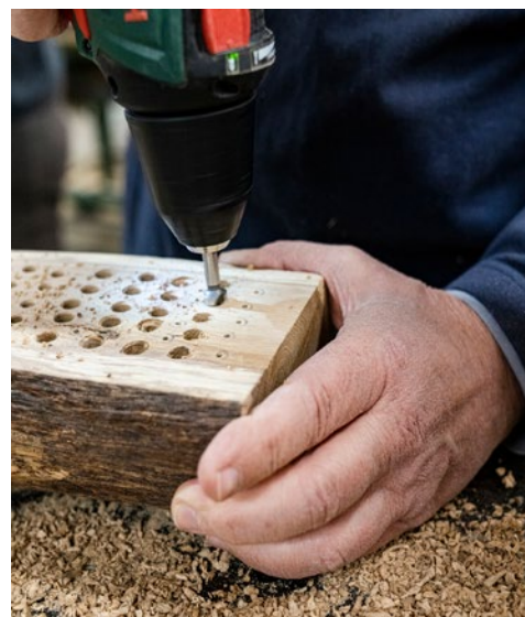
Löcher sollen nur ins Längsholz gebohrt werden.

Möchte man gezielt Nisthilfen für manche Spezialisten unter den Wildbienen schaffen, kann man auch einen dicken abgestorbenen oder morschen Baumstamm neben sein Wildbienenhotel stellen. Sehr seltene Arten wie die Holzbiene, sind sehr stark an solche Nistgelegenheiten gebunden. Je vielfältiger Sie Ihr Wildbienenhotel mit den hier vorgestellten Materialien bestücken, desto größer ist die Vielfalt der Wildbienenarten, die hier einen Nistplatz finden.