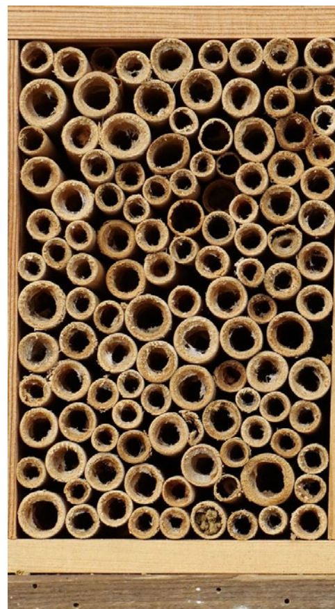
Unterschiedlich dicke Stängel können von mehreren Bienenarten besiedelt werden.