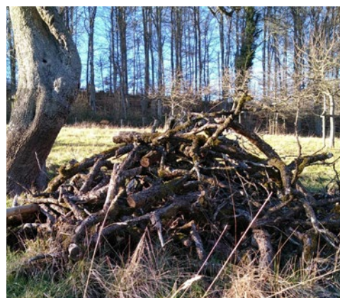
Totholz wird von unzähligen Tieren genutzt, darunter auch spezialisierte Bienenarten.