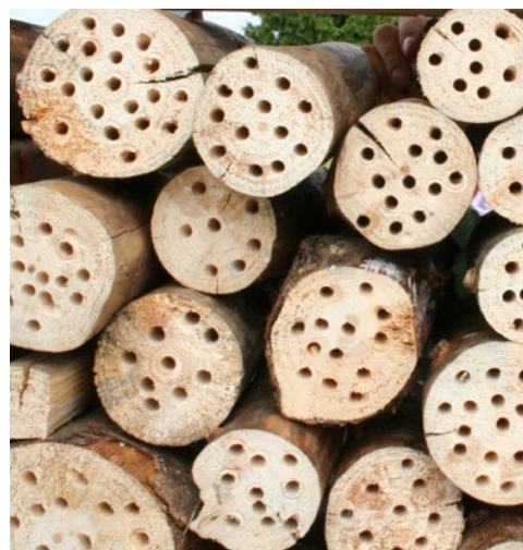
Diese mit Rissen versehenen Baumscheiben sind ungünstig für Wildbienen. Durch die Risse können Feuchtigkeit und Brutparasiten leicht eindringen.